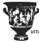
urna -ae f