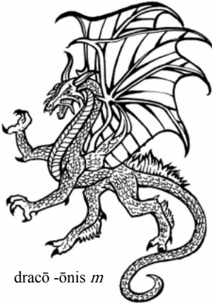
dracō -ōnis m

dracō -ōnis m = serpēs circum-icere; faciem eius dormientis dracōnem circumiectum esse visum est . populāris -e = grātus populō fātīdicus -a -um (< fātum) = quī futūra praedicit af-flāre = īnspirāre (animōs) an-nuntiāre = nuntiāre dēsītūrus part fut < dēsinerē