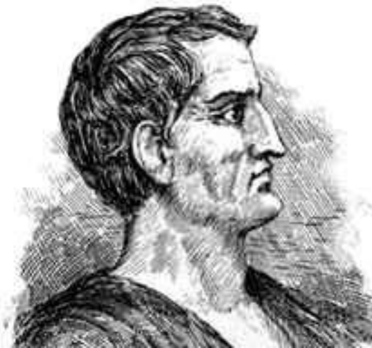
Marcus Licinius Crassus

ab-iectus -a -um = vīlis vīsum est pūtīdus -a -um = quī malī odōris est (: foedus)