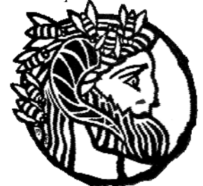
Liber, deus vīnī (= Bacchus)