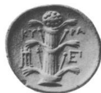
lasarpīcium in nummō

bāsiātiō -ōnis f = ōsculum satis superque = plūs quam satis quam magnus numerus = tot (bāsiātiōnēs) quot Libyssus -a -um < Libya , regiō Africae harēna -ae f = terra sicca lītorum lasarpīcifer -fera -ferum = quī lasarpīcium fert Cyrēnae -ārum f , oppidum Libyae