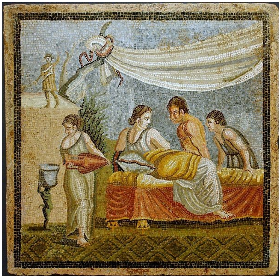
Imāgō amantium in lectō in vīllā Rōmānā reperta