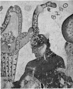
Orcus, deus Īnferōrum

turgidulus = turgidus ocellus -ī m = (parvus) oculus