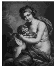
Venus et Cupīdo

nescio- quid cārum lubet : libet iocārī = iocō ūfī; iocus -ī m = lūdus sōlāciolum -ī n = parvum sōlā- cium = cōsōlātiō (< cōsōlārī) ac- qui escere = cessāre ārdor -ōris m = studium, cupi- ditās utinam possem tristīs : tristēs | tristīs cūrās